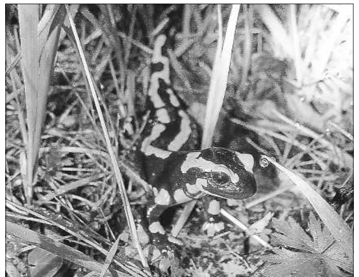
Der seltene Feuersalamander im Kreuzertal

Örtliche Naturschutzvereine erkannten früh den Wert dieses Biotops und setzten sich für dessen Erhalt ein. Seit über 15 Jahren wird die Pflege in Zusammenarbeit zwischen den Naturschutzverbänden, dem Schwarzwaldverein, der Kreisjägersvereinigung, dem Landratsamt Calw und der Stadt Nagold organisiert. Seit diesem Jahr nimmt die Stadt Nagold mit der Fläche auch am sogenannten Kreispflegeprogramm, einem Förderinstrument des Landes, teil. Dafür erhält die Stadt einen Zuschuss zu den Pflegekosten. Die notwendigen Pflegemaßnahmen werden jährlich gemeinsam mit dem Landschaftserhaltungsverband Calw festgelegt und mit den örtlichen Verbänden umgesetzt. Dadurch soll das Kreuzertal auch zukünftig ein wertvolles Habitat für eine der bedeutendsten Feuersalamander-Populationen im Landkreis Calw bleiben.