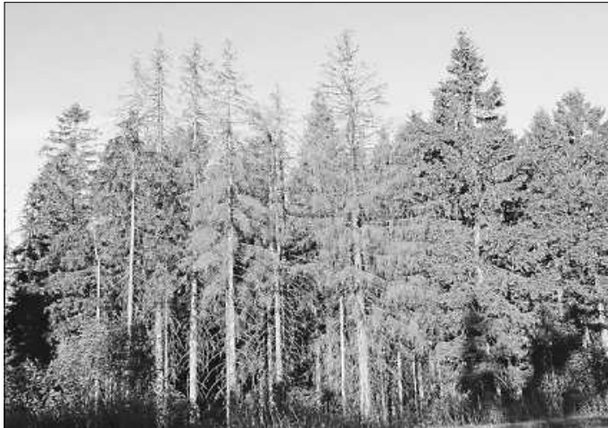
Schadholz bietet Lebensraum für den Borkenkäfer

Fragen der Waldbewirtschaftung und des Holzverkaufs beantworten die Revierförster/-innen gerne auch Privatwaldbesitzern. Selbstverständlich steht ebenfalls die Abteilung Forstbetrieb und Jagd im Landratsamt Calw unter 07051 160-681 zur Verfügung.