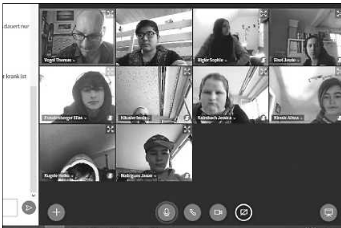
Inzwischen Alltag für die 7a: Unterricht als Videokonferenz