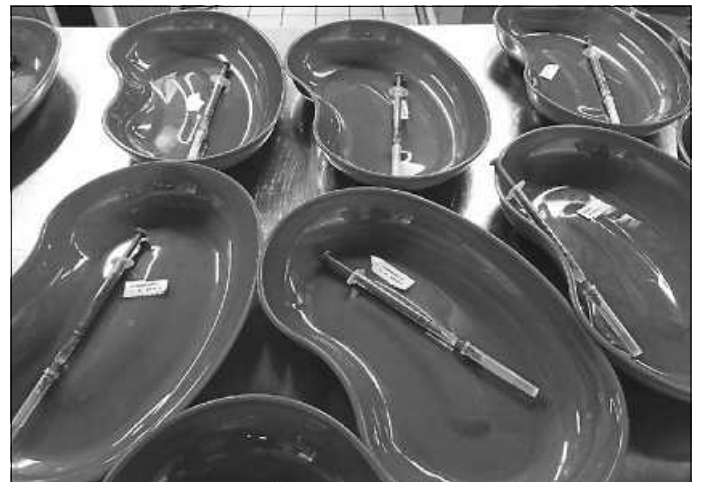
Im Kreisimpfzentrum Calw bleibt keine gelieferte Impfung liegen.

„Das Kreisimpfzentrum in Wart ist gut aufgestellt. Wir verimpfen jede Dosis, die bei uns ankommt. Und wir könnten unsere Kapazitäten noch steigern. Wir sind bereit für mehr und sind auch im ständigen Austausch mit allen Beteiligten. So können wir auf Änderungen – z.B. in der Lieferung des Impfstoffs – schnell und unbürokratisch reagieren“, so Norbert Weiser, Leitung des Kreisimpfzentrums.