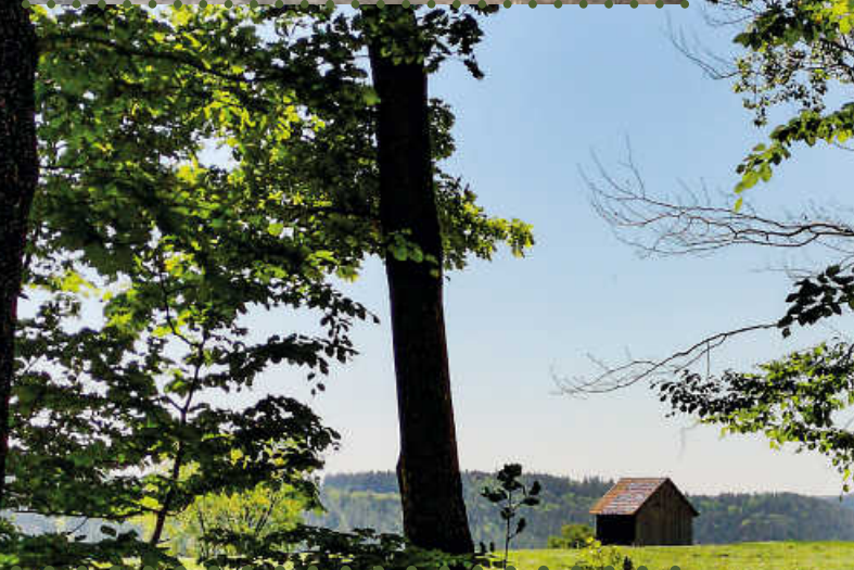
Teufelsbrücke Bad Teinach