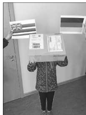
Liebevoll gestaltete Briefe ...auf dem Weg nach Hawaii von der GMS