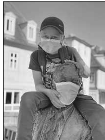
Hermann Hesse

Aus dem Material erstellten die Lehrkräfte für ihre Klassen ein interaktives Heft mit Tipps zum Wandern, einer Wegbeschreibung, über QR-Codes verlinktem Zusatzmaterial, Rätseln und Aufgaben, wie z. B. „Schieße ein Selfie mit Hermann Hesse“.