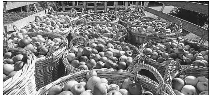
Mit den geförderten LEADER-Projekten wird u.a. zum Erhalt der Streuobstwiesen in der Region beigetragen und damit wichtige Landschaftselemente erhalten.

Bei Interesse empfiehlt es sich, zeitnah Kontakt mit der Geschäftsstelle aufzunehmen um die Fördervoraussetzungen zu klären und den Antrag abzustimmen (Tel. 07051/160-197, E-Mail: Stefanie.Baier@kreis-calw.de ).