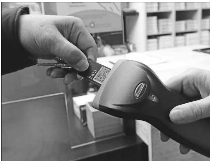
Der luca-Schlüsselanhänger kann einfach eingescannt werden.

Auf der Homepage www.kreis-calw.de können Bürgerinnen und Bürger des Landkreises Calw unter dem Reiter ‚luca App‘ kostenfrei Schlüsselanhänger bestellen.