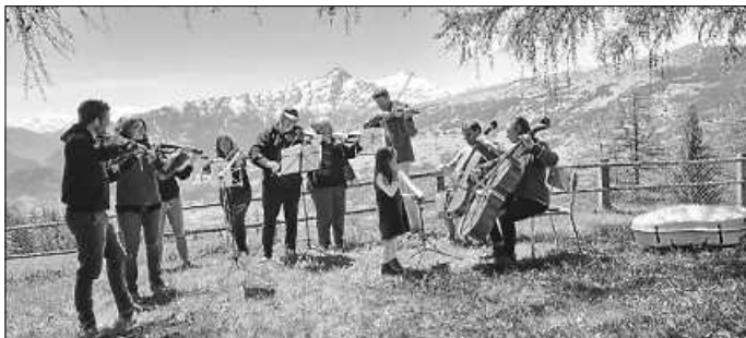
Die Kammerakademie Calw bei Proben unter freiem Himmel in den Schweizer Bergen - bald wird sie in Konzerten auf Schwarzwaldhöhen zu erleben sein.

Der Eintritt zu den Konzerten ist frei, um Spenden wird gebeten. Für Menschen, die die Strecken zu Fuß nicht bewältigen können, wird die Möglichkeit bestehen, die entsprechenden Orte mit dem Auto anzufahren. Nähere und tagesaktuelle Informationen zur Route, Parkmöglichkeiten, den Programmen etc. unter: www.kammerakademie.de .