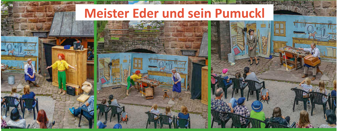
Meister Eder und sein Pumuckl