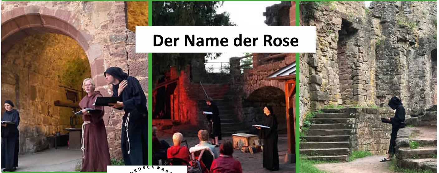
Der Name der Rose