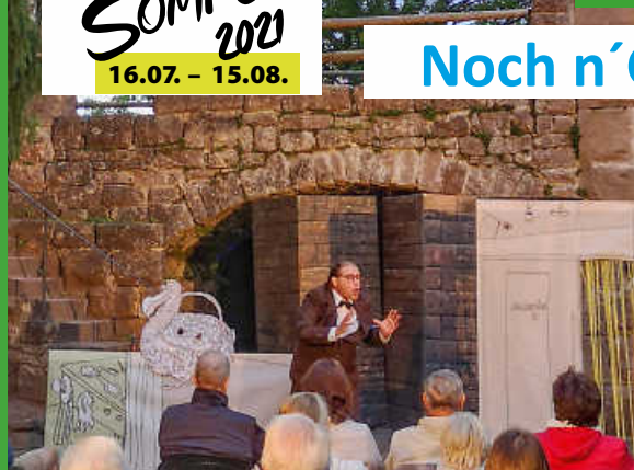
Noch n' Gedicht