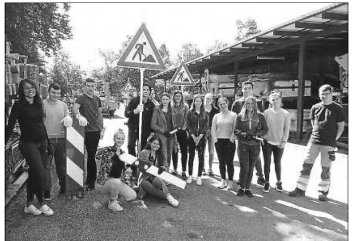
Die Auszubildenden und Studierenden bei der Einführungswoche. Hinweis: Bei der Veranstaltung wurden die 3G-Regeln eingehalten.

Weitere Informationen gibt es unter www.kreis-calw.de/Ausbildung .