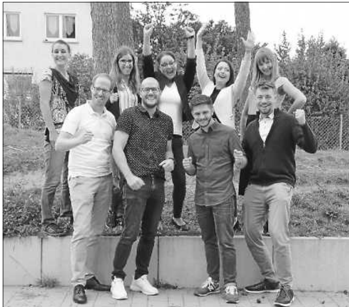
Herzlich willkommen im Team

Weitere Informationen zu unseren neuen Lehrkräften haben wir auf unserer Homepage www.gms-neubulach.de ->Gemeinschaft ->Schulleitung und Lehrkräfte ->Steckbrief unter dem jeweiligen Bild.