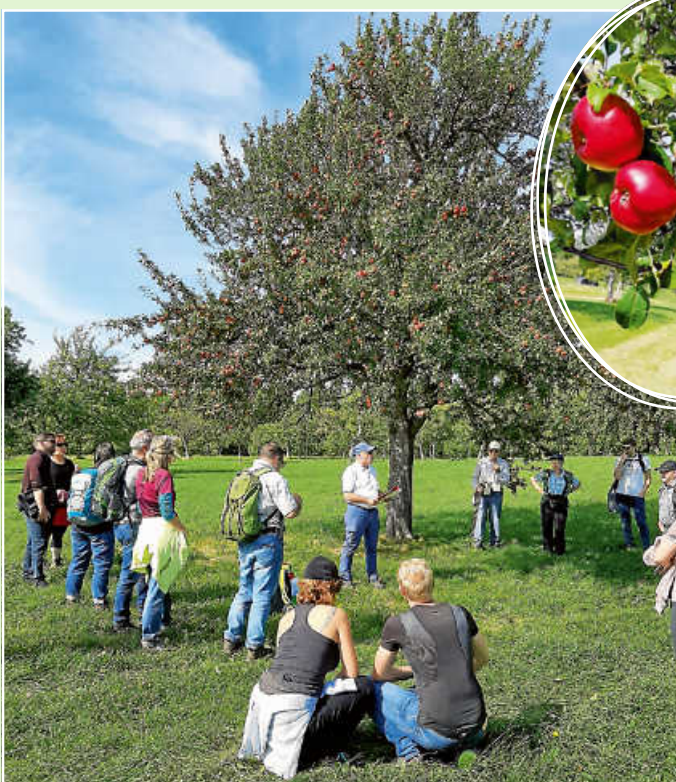
Besuch einer Streuobstwiese bei Oberhaugstett