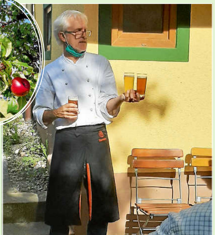
Bierprobe beim Brauhaus Rössle in Neubulach