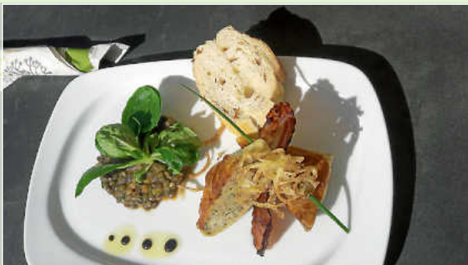
Regionale Vorspeise beim Landgasthof Löwen in Oberhaugstett