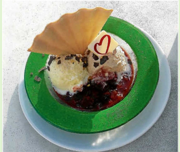
Krönender Abschluss mit hausgemachtem Eis an saisonalen Früchten bei Eis & Café in Neubulach