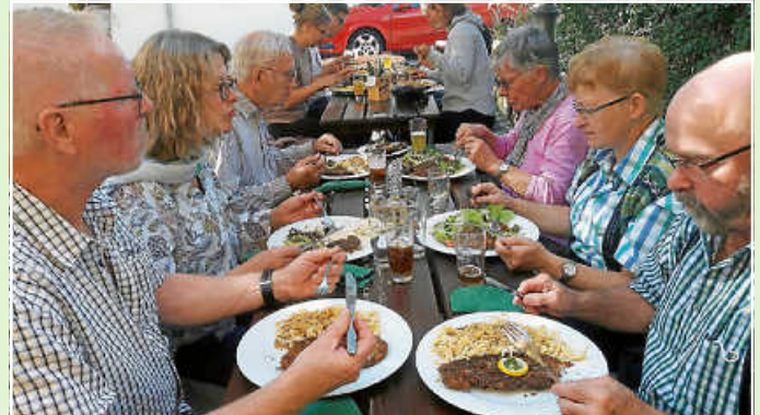
Außergewöhnlicher Hauptgang beim Brauhaus Rössle in Neubulach