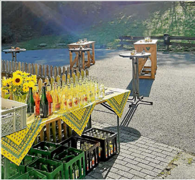
Apero „Rohrspatz Craft Cider“ an der Lochsägmühle Neubulach