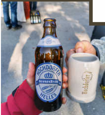
2. Teinachtaler Bierwanderung 17.10.