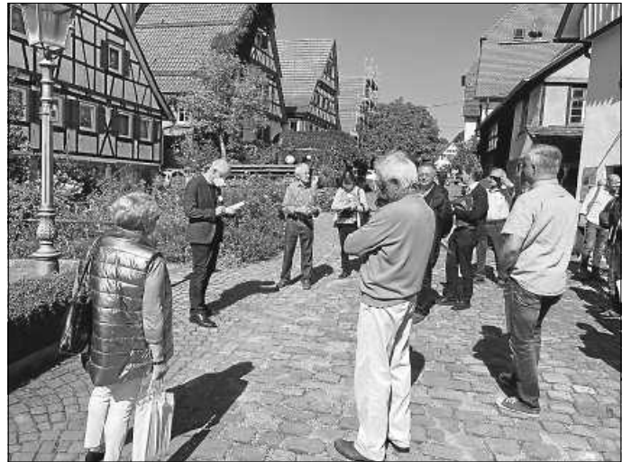
Besuch der Kommission

Weiterführende Informationen zum Dorfwettbewerb sind im Internet zu finden unter: www.dorfwettbewerb-bw.de und www.dorfwettbewerb.bund.de