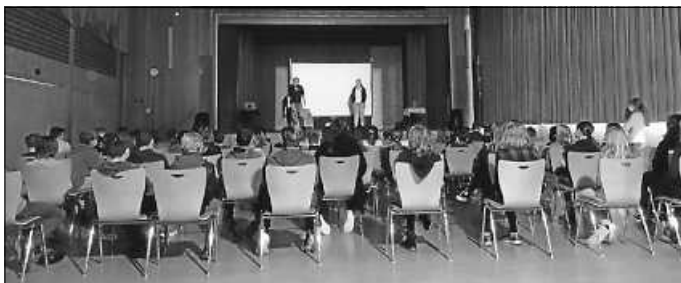
Gebannt folgen die Schüler dem Theaterstück

Um diese Fragen aufzuwerfen, griff das Theaterensemble immer wieder auf die Lebenswelt der Schüler zurück. Dass hier mit angesagten Rappern, Themen und Computerspielen der richtige Ton getroffen wurde, zeigten auch die Rückmeldungen der Schüler. „Bei den Ausrastern bei Fortnite fühlte ich mich echt ein bisschen an mich selbst erinnert.“, bekannte ein Siebtklässler und eine Mitschülerin ergänzte: „Ich fand das Theater echt gut, weil wir oder Freunde von uns so etwas Ähnliches schon erlebt haben. Deswegen hätte ich gerne noch mehr Spielszenen gesehen.“