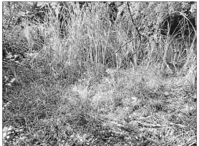
Der Tümpel in der Nähe vom Würzbacher Kreuz vor der Instandsetzung (links) und danach (rechts).

In diesem Rahmen wurde sowohl das Naturschutzgesetz als auch das Landwirtschafts- und Landeskulturgesetz geändert. Unter anderem ist nun die Beleuchtung von öffentlichen Gebäuden zu reduzieren und Schottergärten sind verboten. Ziel ist es, den landesweiten Biotopverbund auf mindestens 15 Prozent der Offenlandfläche bis 2030 auszuweiten. Ein weiterer wichtiger Bestandteil ist die Erhaltung der Streuobstbestände, die jetzt gesetzlich geschützt sind und erhalten werden müs-