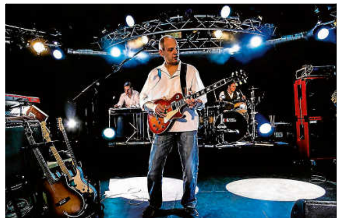
DIRE sTRAITS Tribute Show