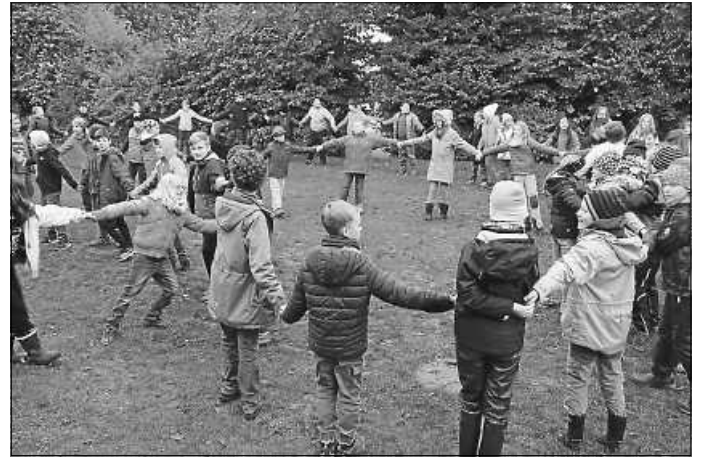
Gruppendynamische Aktivitäten standen bei den Kennenlertagen der fünften Klassen im Fokus.