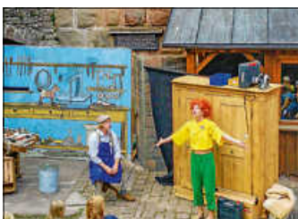
Beim Zavelsteiner Burgtheater

Datum: Donnerstag, 7. April Uhrzeit: 16:00 Uhr Ort: Ko-Ni Zavelstein Tickets: online unter: www.regionentheater.de/pumuckl