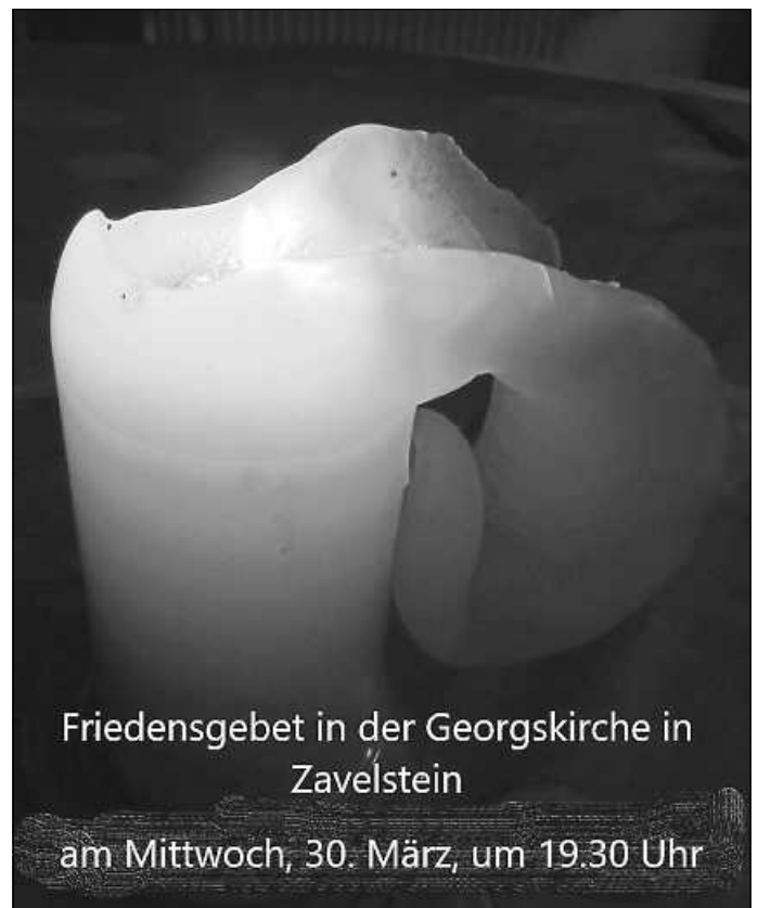
Plakat: Pfarramt Bad Teinach-Zavelstein