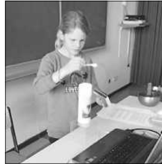
Das Friedenslicht wird entzündet