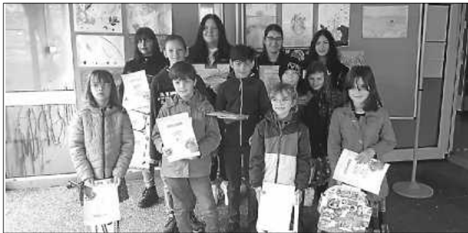
Die Sieger*innen aus den teilnehmenden Klassen

Am 5. Mai fand die Preisverleihung des diesjährigen Malwettbewerbs der Volks- und Raiffeisenbanken statt. Die Preisverleihung durfte zum Glück wieder in Präsenz stattfinden, so dass sich alle Schülerinnen und Schüler um 9 Uhr im Schulhof der Grundschule versammelten. Am 52. Internationalen Jugendwettbewerb zum Thema: „Was ist schön?“ nahmen die Klassen 1 – 4, 9 und 10 teil und es gab viele strahlende Gesichter.