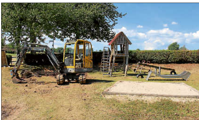
Neues Spielgerät für den Spielplatz an der Birkenwaldstraße

Die Mitarbeiter des städtischen Bauhofs nutzen das schöne Sommerwetter unter anderem auch dafür, um Spielgeräte auf den städtischen Spielplätzen zu erneuern. So wurde beispielsweise in der letzten Woche auf dem Spielplatz zwischen Sommenhardt und Lützenhardt ein neues Spielgerät aus Robinienholz aufgestellt.