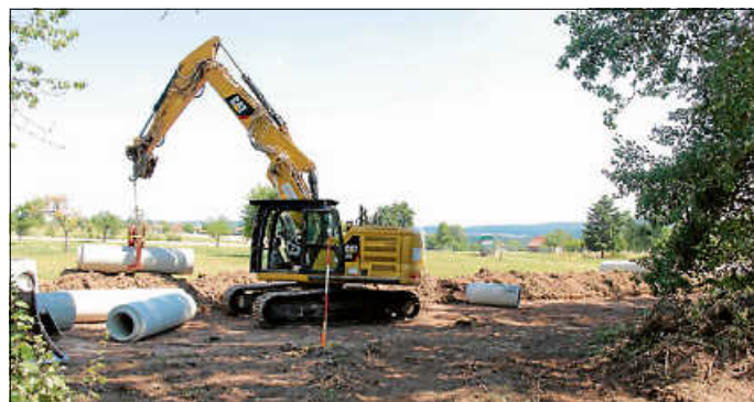
Kanalsanierung hinter der Calwer Straße in Sommenhardt

Auch in den Sommerferien schreiten die städtischen Baumaßnahmen weiter voran. So erfolgt derzeit beispielsweise nach dem Abschluss der Kanalsanierung im Bereich Mittelbach in Sommenhardt hinter den Gebäuden entlang der Calwer Straße eine weitere umfangreiche Kanalsanierungsmaßnahme.