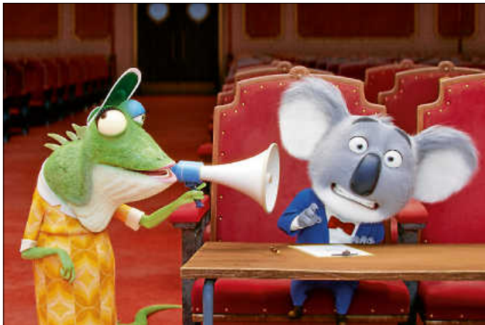
Szene aus „SING 2“

Koala Bär Buster Moon hat einen Traum: Er will mit seiner singenden Truppe im berühmten Crystal Theater auftreten. Damit das gelingt, behauptet er, den lange verschollenen Rockstar Clay Calloway auf die Bühne zu holen. Ein gewagtes Versprechen.