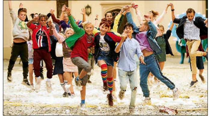
Szene aus „Die Schule der magischen Tiere“