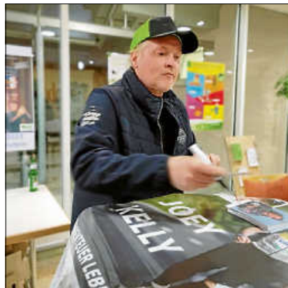
Joey Kelly im Gespräch mit Fans