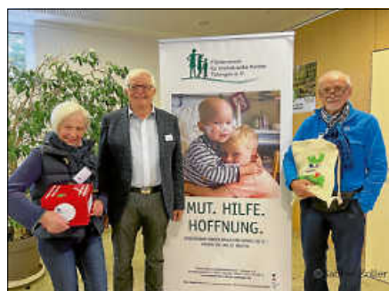
Der Förderverein für krebskranke Kinder in Tübingen e. V. präsentiert sich im Ko-Ni