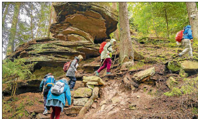
Gut gelaunte Wanderer unterwegs am Stubenfelsen