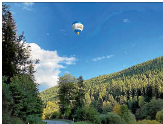
Heißluft-Ballon der Mineralbrunnen Teinach GmbH hebt mit den Gewinnern des Spenden-Wander-Marathons ab