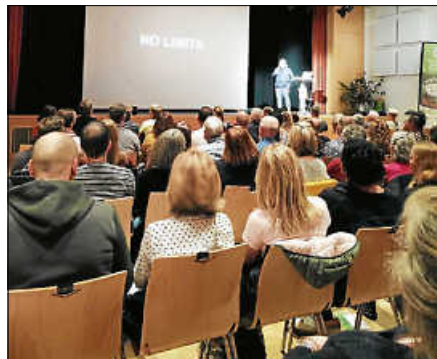
Spannender Multivisionsvortrag mit Joey Kelly am Vorabend des Spenden-Wander-Marathons