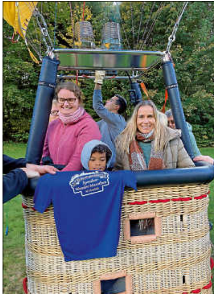
Strahlende Gewinner der Verlosung einer Heißluft-Ballonfahrt