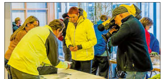
Ausgabe der Starterbags am Samstagmorgen