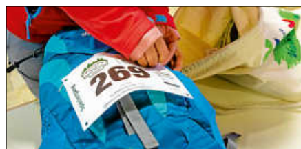
Anbringen der Startnummern