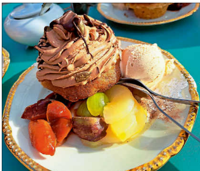
Süßer Abschluss der Tour im Café Zavel