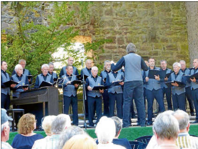
Sängerabteilung des Schwarzwaldvereines Zavelstein e.V.

Mit dabei: Der Männergesangsverein Frohsinn Neuweiler, der seine Zuhörer seit mittlerweile fast 70 Jahren erfreut sowie der Gesangsverein Sängerbund Rotfelden, der diesen in vergangener Zeit bereits mehrmals vereinsübergreifend unterstützte. Ebenfalls werden die Posaunenchor Neuwiler und Zwernenberg den Abend bereichern. Der Posaunenchor aus dem Kirchspiel Zwernenberg ist übrigens der älteste Posaunenchor im Kreis Calw und besteht bereits seit ca. 140 Jahren. Der Zylinderchor Neuweiler - entstanden aus der AH-Abteilung des Fußballclubs Neuweiler (FCN) - zeigt ebenso wie die Sängervereinigung des Schwarzwaldvereines Zavelstein e.V. an diesem Abend sein Können und die Verbundenheit mit krebskranken Kindern und deren Familien. Kommen auch Sie an diesem Abend vorbei und freuen sich mit uns auf einen klangvollen Abend. Der Eintritt ist frei, um Spenden zugunsten des „Fördervereins für krebskranke Kinder in Tübingen e.V.“ wird gebeten.