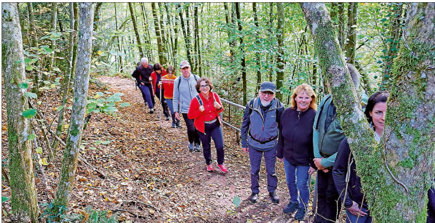
Unterwegs im herbstlichen Wald