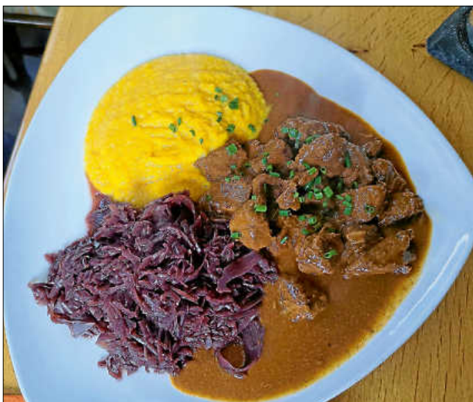
Wildragout, Kürbispüree und Rotkraut im Waldhorn