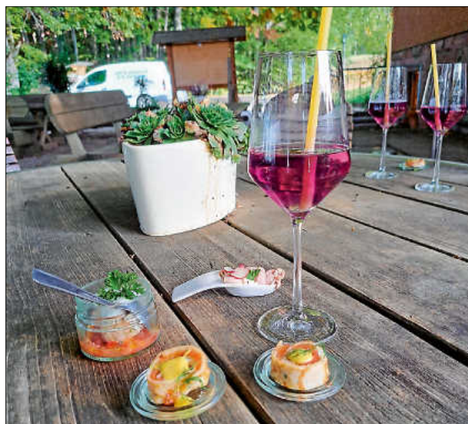
Apéritif und Vorspeise im Wanderheim

Die nächste geführte Tour dieser Art mit Schwarzwald-Guide Jürgen Rust findet am 03. Juni 2023 statt!