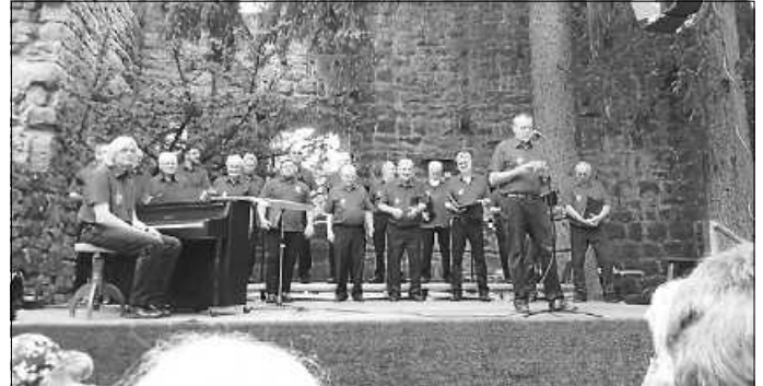
Beim Auftritt in der Zavelsteiner Burgruine

Ebenfalls werden die Posaunenchöre Neuweiler und Zwerenberg den Abend bereichern. Der Posaunenchor aus dem Kirchspiel Zwerenberg ist übrigens der älteste Posaunenchor im Kreis Calw. Der Zylinderchor Neuweiler zeigt ebenso wie die Sängerabteilung des Schwarzwaldvereines Bad Teinach-Zavelstein e.V. an diesem Abend sein Können. Kommen auch Sie an diesem Abend nach Zwerenberg und freuen sich mit uns auf einen klangvollen Abend. Der Eintritt ist frei, um Spenden zugunsten des „Fördervereins für krebserkrankte Kinder in Tübingen e.V.“ wird gebeten.