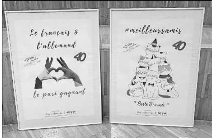
Gastgeschenk aus der Bretagne