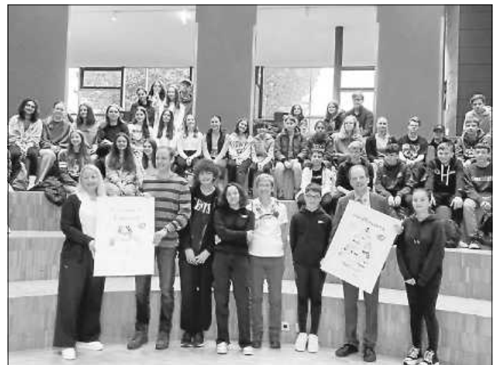
Herzlicher Empfang der Gäste aus der Bretagne im Forum der HIP Realschule Calw

In diesem Jahr feiern das Collège St. Julien aus Malestroit, die Heinrich-Immanuel-Perrot Realschule und das Hermann-Hesse Gymnasium ihre 40-jährige Schulpartnerschaft. Eine mittlerweile seit 40 Jahren bestehende Freundschaft.