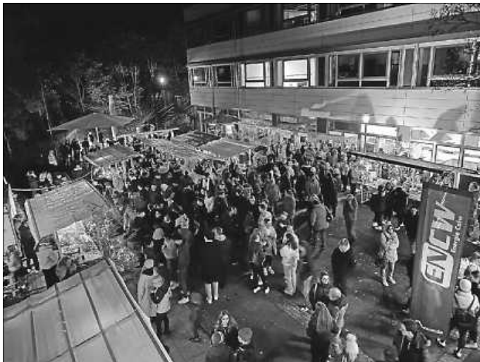
Großer Andrang beim Adventsmarkt.