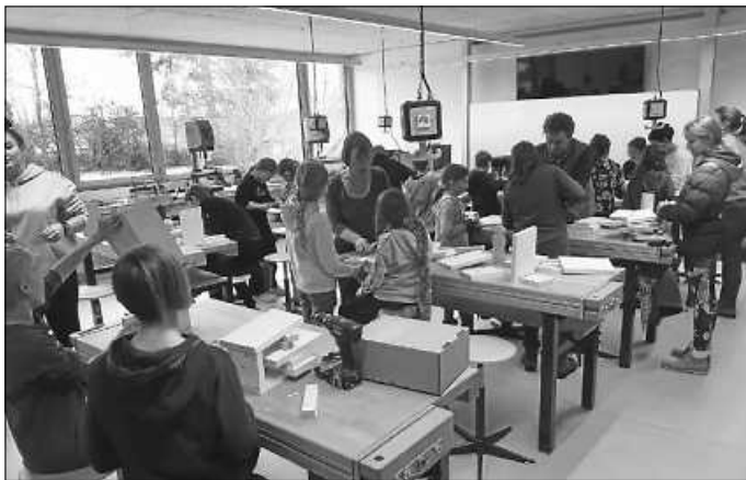
Bau der Nistkästen in den Fachräumen der GMS Neubulach