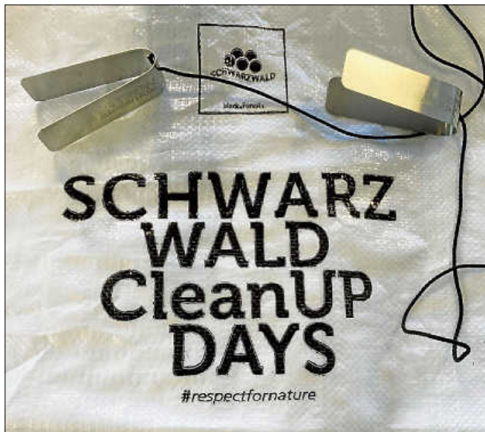
Müllsäcke und Greifzangen zur Aktion

Die Ausgabe der Müllsäcke und der Greifzangen sowie die Rücknahme des gesammelten Mülls erfolgt für den Bereich um Bad Teinach-Zavelstein über die Tourist-Info | Teinachtal-Touristik Bad Teinach-Zavelstein.