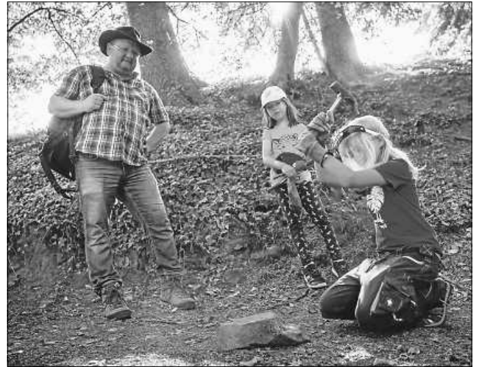
Geo-Erlebnistour Bad Teinach-Zavelstein

Dies und noch viel mehr erwartet Sie bei einer exklusiven Geo-Erlebnistour in Bad Teinach-Zavelstein.