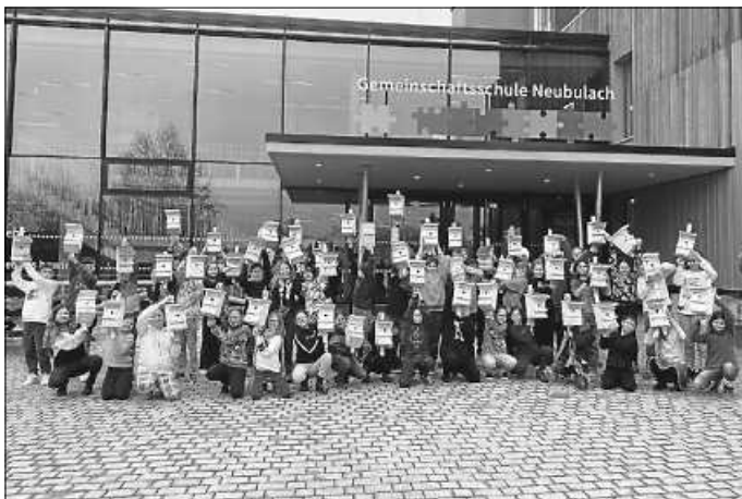
Stolz und begeistert halten die Schüler*innen ihre selbstgebaute Nistkästen in die Kamera.