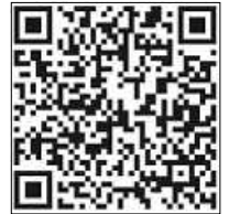
QR Code direkt zur Tour

Die Rundtour über 160 km führt einmal durch den Landkreis Calw und kann wahlweise von verschiedenen Punkten aus gestartet werden. Es warten tolle Highlights sowie landschaftliche Abwechslung.