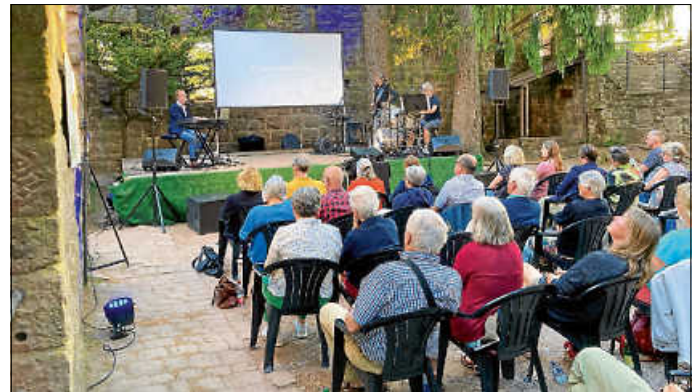
Mitsingen in der Aufwärmphase mit Peter Maffay Song