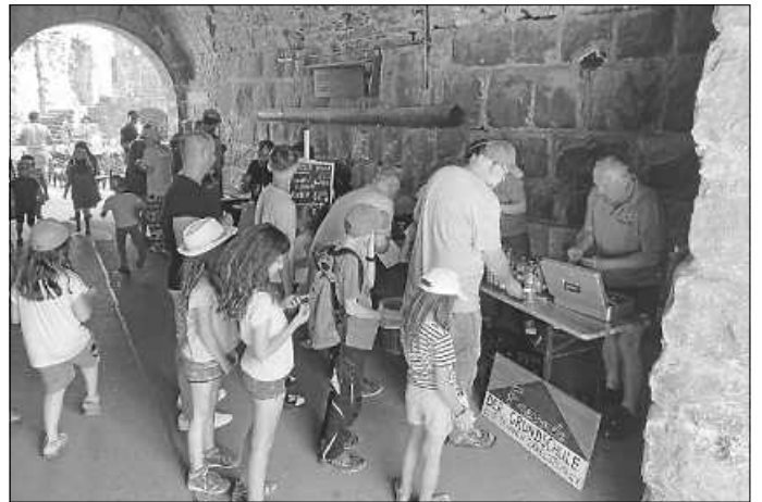
Weitere Erfrischungen beim Förderverein "Freunde der Grundschule e.V."