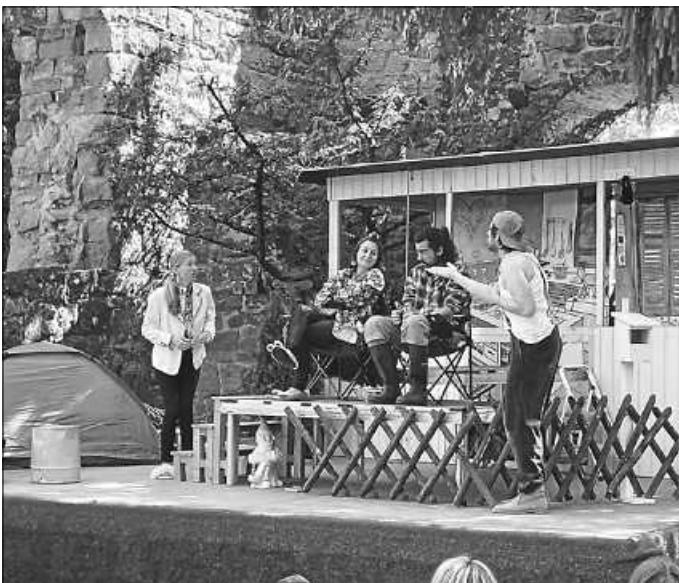
Stückbeginn der Neuinszenierung