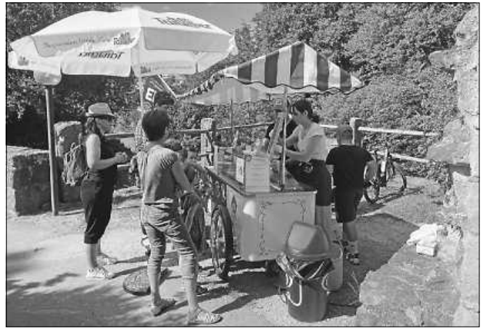
Eiswagen sorgt für Erfrischung bei Klein & Groß