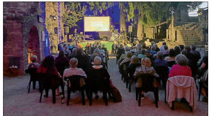
Internationale Ohrwürmer brachten Abwechslung ins Programm