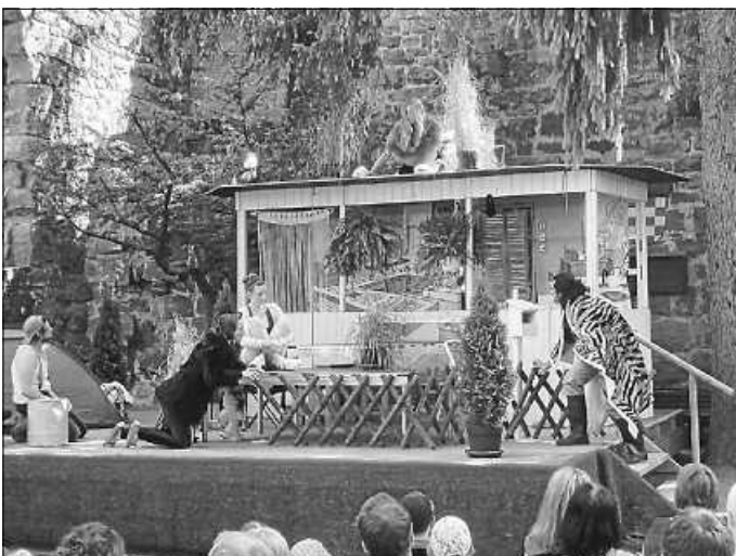
Szene aus dem Familienabenteuer