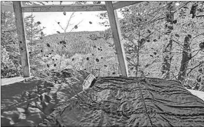
Einziger Ausblick vom Baumhaus

Neugierig? Dann schaut Euch schnell den Blogbeitrag auf unserer Homepage unter: www.teinachtal.de/blog an. Von dort gelangt Ihr auch direkt zur Buchung.