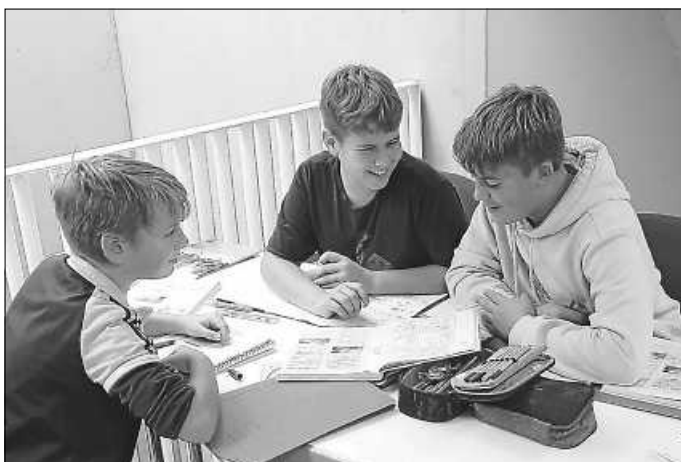
Sehr beliebt sind die gemütlichen Arbeitsplätze im Lernflur der GMS Neubulach

Wir freuen uns auf die Begegnungen und die Gespräche!“ (Dominik Bernhart)