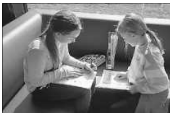
Arbeiten in der Lern-Lounge der GMS Neubulach

Auf der Homepage der Schule ( www.gms-nebulach.de ) gibt es eine extra eingerichtete „ Fünfer-Sonder-Seite “, die mit Erklärfilmen zum Konzept, Antworten auf häufig gestellte Fragen (FAQs), einem großen Download-Angebot und Informationen zur Schulanmeldung wichtige Informationen zur Verfügung stellt. Für individuelle Fragen steht das Team der GMS zur Verfügung und bietet dafür einen Rückruf-Service unter 07053 9686-0 an.