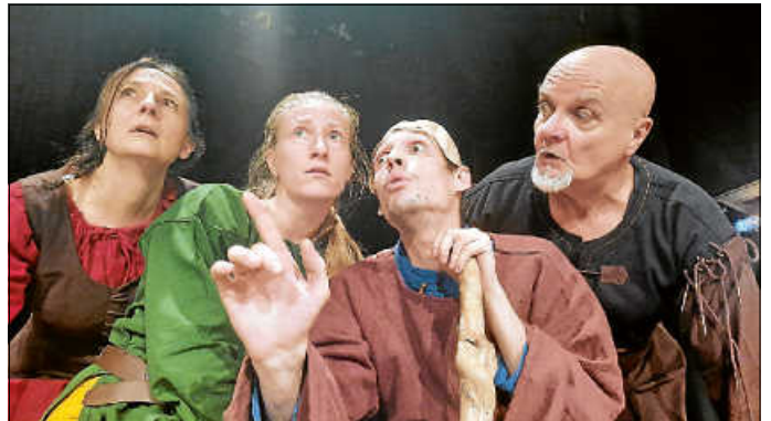
Szene aus dem Stück „Ronja Räubertochter“