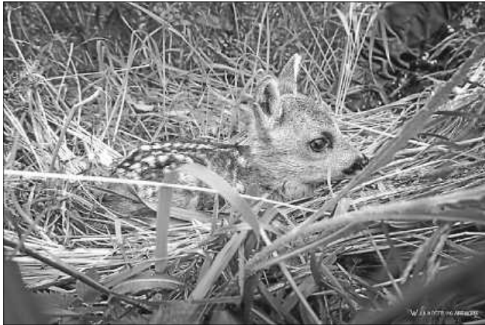
Ein Rehkitz wurde in einer Wiese entdeckt.

Bei Fragen oder weiteren Auskünften wenden Sie sich bitte an: KJV Calw e. V., Simon Metz, Tel. 07052 9343632