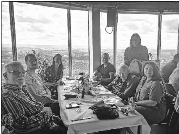
Hoch hinaus mit den Glücksmomenten

Weitere Infos: Ansprechpartnerin Birgit Klaus|Tel. 07051 7009-3230|E-Mail: birgit.klaus@drk-kv-calw.de