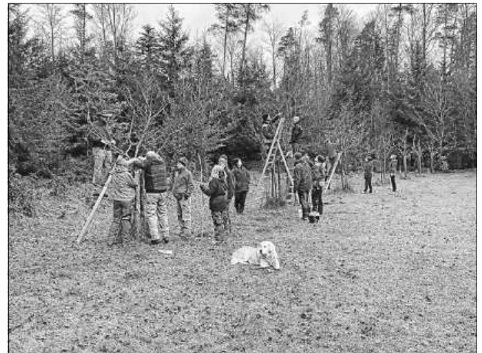
Kursteilnehmer des Fachwartkurses für Obst und Garten

Kursteilnehmer müssen vor Beginn des Fachwartekurses an mindestens einem mehrtägigen Obstbaumschnittkurs teilgenommen haben. Im Dezember wird deshalb für die Teilnehmer, die noch keinen mehrtägigen Kurs besucht haben, ein vorbereitender Kurs angeboten. Die Teilnahme am Kurs zur Erlangung der Sachkunde im Pflanzenschutz ist verpflichtend, die Ablegung der Sachkundeprüfung ist allerdings freiwillig. Ein Sachkundekurs wird im Vorfeld eines Fachwartekurses von der Abteilung Landwirtschaft und Naturschutz im November angeboten. Eine schriftliche und praktische Prüfung erfolgt im März 2025.