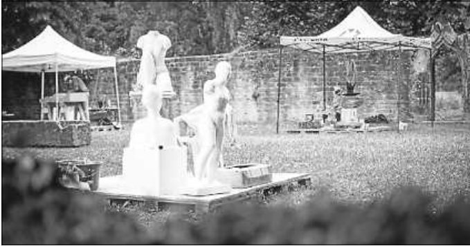
Eindrücke vom letzten Bildhauersymposium 2022

Die Veranstaltung wird von der Sparkasse Pforzheim-Calw gefördert.