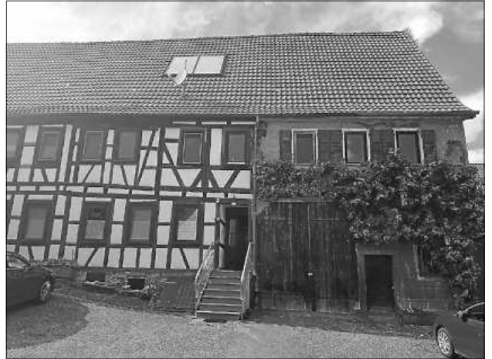
Das ELR unterstützt vor allem Projekte im Bereich Wohnen, wie hier die Erweiterung von Wohnraum durch den Ausbau nicht genutzter Fläche im Dachstock.

Weitere Informationen sind auch im Internet unter www.kreis-calw.de/elr zu finden.