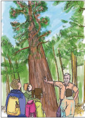
Robert Roller an der Omatanne im Röttenbacher Wald

Termin: 15. August 2024 Zeit: 13.30 -15.30 Uhr Anmeldung: Teinachtal-Touristik Tel. 07053 9205040 | info@teinachtal.de Gebühr: 5 €, Kinder bis einschl. 14 Jahren Weglänge: 4 km mit ca. 20 Höhenmetern Treffpunkt: Parkplatz Zettelberg bei den Blumenfeldern