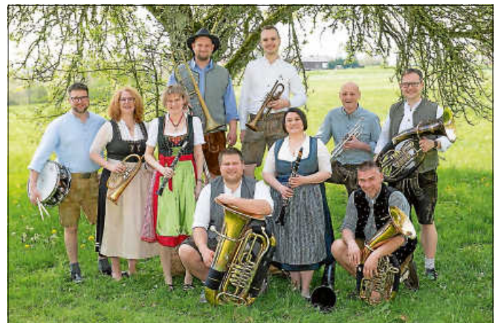
Kapelle Berg und Tal

Der Schwarzwaldverein Calw und die Teinachtal-Touristik laden erneut zu einem schwungvollen Sommerabend – in diesem Jahr mit der Kapelle „Berg & Tal“ – aus der Region ein. Diese Formierung aus begeisterten Musikerinnen und Musikern aus verschiedenen Vereinen des „Blasmusik Kreisverbands Calw“ hat sich der böhmisch-mährischen und modernen Blasmusik verschrieben. Zusätzliche Musizierende stammen aus dem Musikverein Altburg, der Orchestervereinigung Calmbach, der Stadtkapelle Calw, dem Musikverein Schömberg, dazu gesellen sich Freischaffende. Sie sorgen an diesem Abend für Schwung und jede Menge Spaß. Naturpark-Wirt Franz Berlin kreierte mit seinem Wanderheim-Küchenteam passend dazu bayrische Schmankerl.