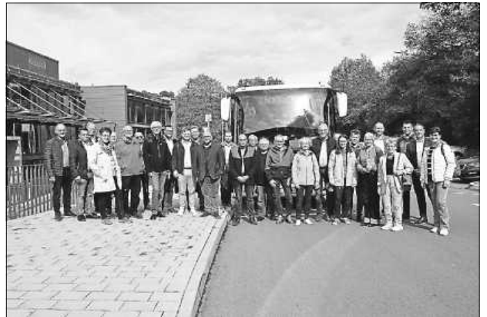
Tour des Kreistags zu wichtigen Infrastrukturprojekten im Landkreis Calw.

eindrucksvoll, wie wichtig unsere Investitionen für die Zukunftsfähigkeit der Region sind und tragen maßgeblich zur Lebensqualität der Menschen im Landkreis bei. Gleichzeitig stärken wir durch diese Maßnahmen die nachhaltige Entwicklung und die Wettbewerbsfähigkeit des ländlichen Raums sowie den Anschluss an die Metropolregion Stuttgart. Damit schaffen wir die Basis für einen zukunftssicheren und leistungsfähigen Landkreis Calw.“