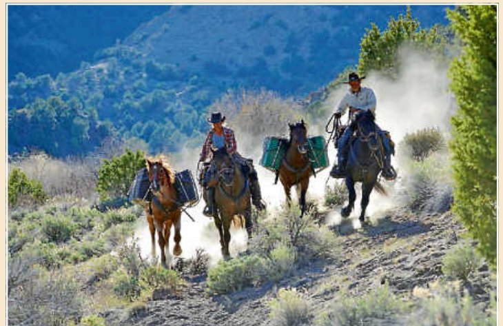
Unterwegs im Sattel durch Amerika