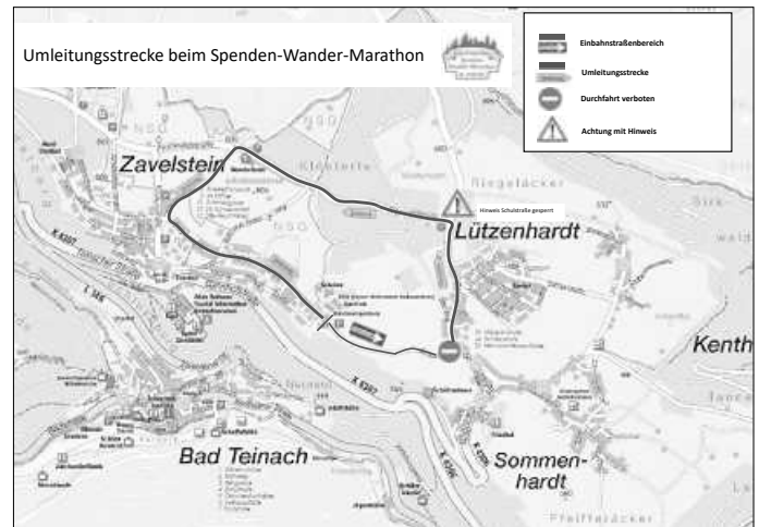
Plan: Umleitungsstrecke in Zavelstein am 28. und 29.09.24

Eine Vollsperrung betrifft die Bereiche der Verbindungsstraße zwischen Bad Teinach und Breitenberg auf Höhe Lautenbachhof und des Wanderparkplatzes am Wasserturm in Neubulach-Liebelsberg anlässlich des 2. Schwarzwälder Spenden-Wander-Marathons von 7:00 Uhr bis 19:00 Uhr .