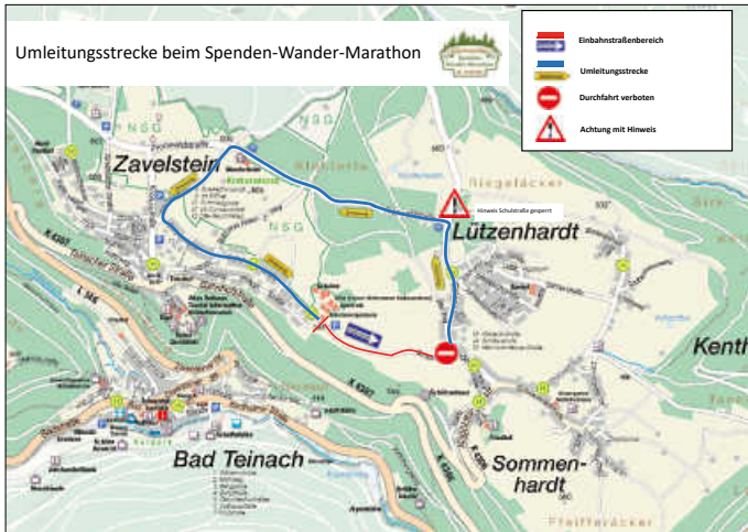
Plan: Umleitungsstrecke in Zavelstein am 28.-29.09.24

Bitte beachten Sie die geänderte Verkehrsführung in Zavelstein: Die Schulstraße vom Abzweig Calwer Straße bis zum Sportgelände wird in Fahrtrichtung Calwer Straße zur Einbahnstraße . Eine Vollsperrung betrifft die Bereiche der Verbindungsstraße zwischen Bad Teinach und Breitenberg auf Höhe Lautenbachhof und des Wanderparkplatzes am Wasserturm in Neubulach-Liebelsberg anlässlich des 2. Schwarzwälder Spenden-Wander-Marathons von 7:00 Uhr bis 19:00 Uhr .