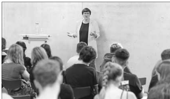
Saskia Esken im Austausch mit den Schülerinnen und Schülern der GMS

Bei den Schülerinnen und Schülern kam die Veranstaltung gut an. Sie hatten die Gelegenheit, gute Fragen zu stellen, die man so normalerweise nicht stellen kann und sie hatten, das Gefühl ernst genommen zu werden. Als Dankeschön für den Besuch überreichten sie Saskia Esken den GMS-Neubulach-Fanschal.