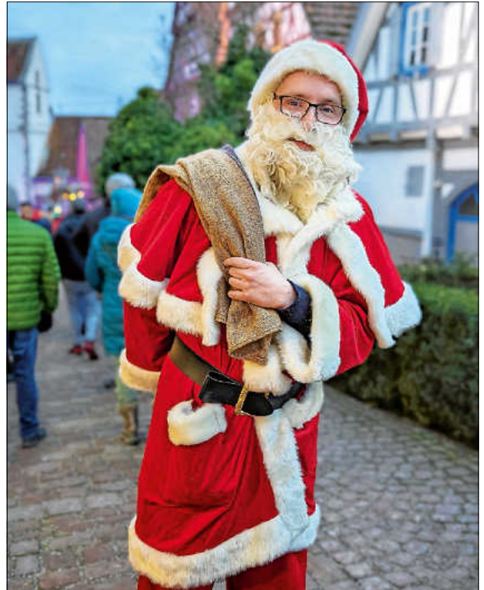
Der Nikolaus kommt auch in diesem Jahr zur Zavelsteiner Burgweihnacht.

Im evangelischen Gemeindehaus öffnet eigens zur Zavelsteiner Burgweihnacht ein liebevoll hergerichteter Advents-Café seine Pforten. Während sich hier die Gäste bei einem Plausch aufwärmen, flaniert draußen der Nikolaus über die Burgweihnacht und beschenkt die Jüngsten mit leckeren Süßigkeiten und Obst.