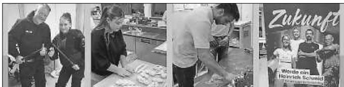
Rückblick auf unseren 3. Neubulacher Ausbildungsmarkt.