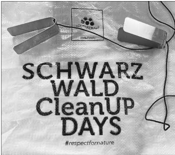
Müllsäcke und Greifzangen zur Aktion

Die Schwarzwald CleanUP Days sind ein gemeinschaftliches Aufräumevent in der gesamten Region im Rahmen der „Respekt.“-Kampagne. Das Ziel ist schnell erklärt: Gemeinsam Aufräumen in der Natur. Einheimische und Gäste setzen zusammen ein wirksames Zeichen. Organisiert werden die Schwarzwald CleanUP Days von der Schwarzwald Tourismus GmbH in Kooperation mit dem gemeinnützigen Verein PATRON e. V. und dem Freiburger StartUp Limonate. Das Event wird gefördert durch das Land Baden-Württemberg, die „European Outdoor Conservation Association“ (EOCA) und die VAUDE Sport Albrecht von Dewitz Stiftung. Darüber hinaus beteiligen sich regionale und überregionale Sponsoren