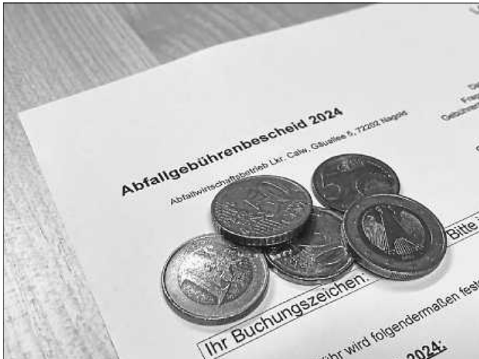
Abfallgebührenbescheide 2024 werden verschickt