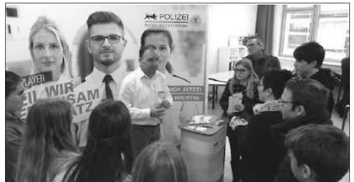
Polizeieinsatz einmal anders. Großes Interesse am Infostand der Polizei Calw.

Viele der anwesenden Betriebe wiederum hoben das Interesse der Schüler/innen und die guten Gespräche mit ihnen und ihren Eltern hervor. Damit unterscheidet sich der „Neubulacher Ausbildungsmarkt“ mit seiner vergleichsweise familiären Atmosphäre wohltuend von den großen Berufswahlmessen der Region. Hier kommt man ins Gespräch, lernt sich kennen und es tun sich Chancen und Perspektiven auf. Diese nutzten viele der Schülerinnen und Schüler gleich, indem sie sich gezielt nach Praktikumsplätzen erkundigten und teilweise auch schon den Lebenslauf mit dabei hatten.