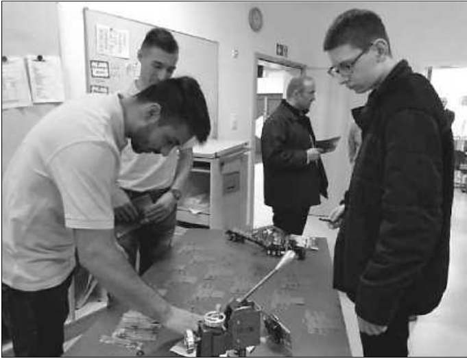
Mit dabei war natürlich auch Veyhl aus Zwerenberg als Bildungspartner der GMS Neubulach.

Dass es eine Fortsetzung geben wird, steht fest, denn: „Gute Bildung findet nicht hinter geschlossenen Schul- und Klassenzimmertüren, quasi in einem "Elfenbeinturm" statt und Schule alleine kann unsere heutigen Kinder und Jugendlichen nicht optimal auf die berufliche und gesellschaftliche Zukunft vorbereiten. Das gelingt nur, wenn viele Akteure zusammenarbeiten und daspielen unsere Bildungspartner und die Unternehmen der Region eine ganz wichtige Rolle.