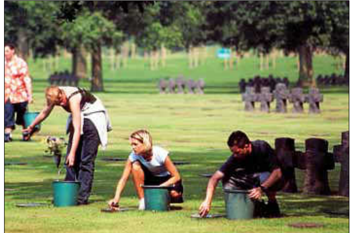
Volksbund. Internationale Jugendbegegnung auf der Kriegsgräberstätte La Cambé