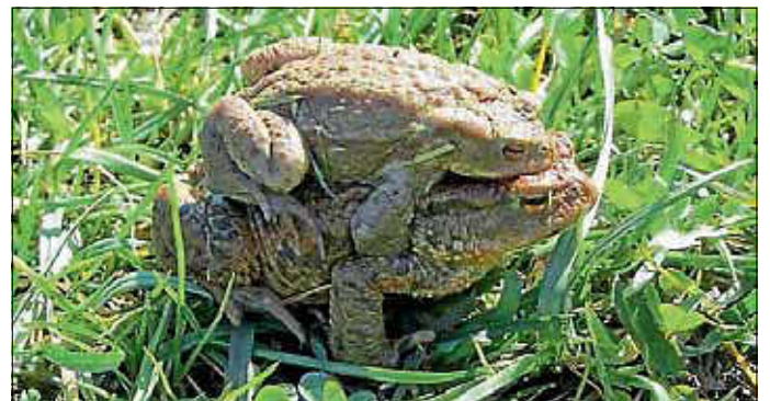
Damit Frösche, Kröten und Co sicher zu ihren Laichplätzen kommen, sollten Verkehrsteilnehmer vorsichtig fahren