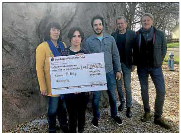
Spendenübergabe an die Grace P. Kelly Vereinigung

zu folgenden Zeiten können Sie Ihr Kind an der Wimbergschule für Klasse 5 im Sekretariat (A-Bau, Obergeschoss) anmelden: