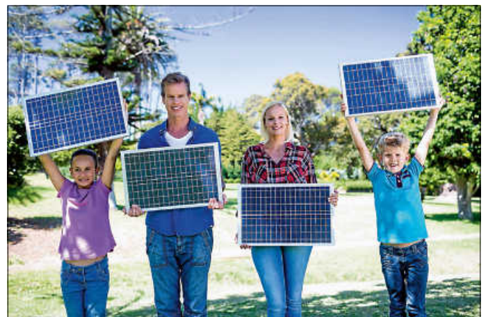
Das Photovoltaik-Netzwerk Nordschwarzwald bietet Beratung, Orientierung und Informationen für solare Vorhaben.

Weitere Informationen zum Photovoltaik-Netzwerk Nordschwarzwald sind im Internet unter www.photovoltaik-bw.de/regionale-pv-netzwerke/nordschwarzwald/ abrufbar.