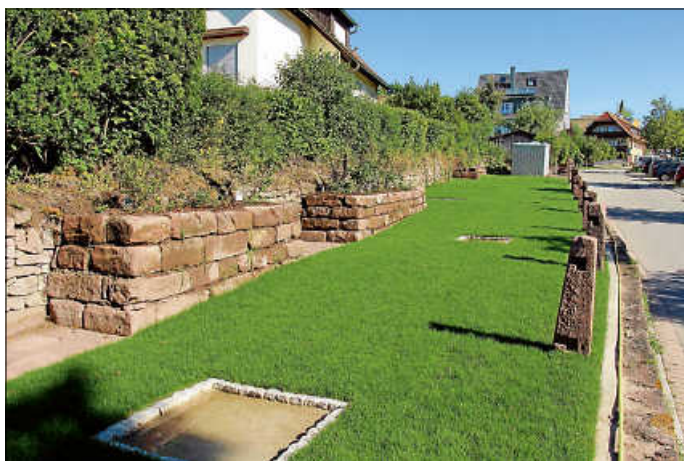
„Pailles-Garten“ an der Krokusstraße