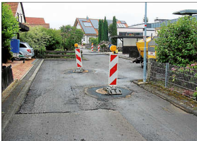
Straßensanierung im Gebiet „Föhrenwald“ in Sommenhardt