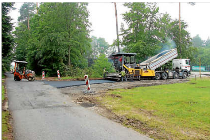
Straßensanierung im Bereich Sportplatz Zavelstein