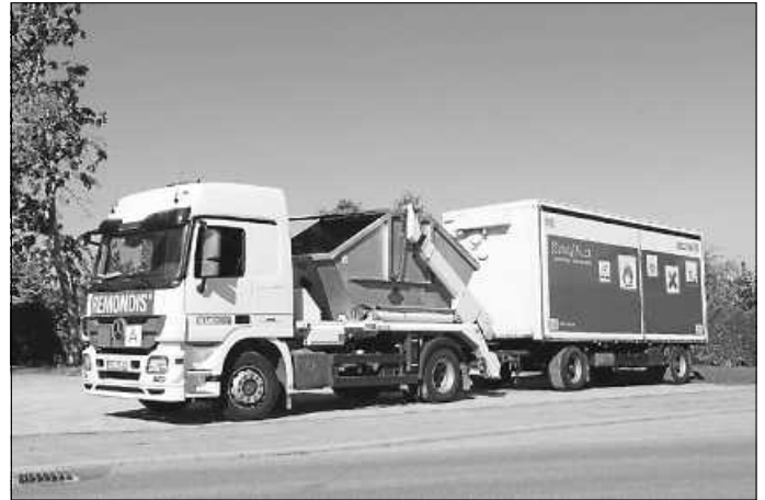
Die Schadstoffsammlung startet im September wieder nach Plan.

Sowohl das Merkblatt mit allen Terminen der Schadstoffsammlung als auch die Abfallkalender der einzelnen Städte und Gemeinden können auf der AWG-Website unter www.awg-info.de eingesehen und heruntergeladen werden. Auch die Abfallberatung unter der kostenlosen Servicenummer 0800 30 30 839 informiert gerne über die Schadstoffsammlung und alle anderen Themen rund um die Abfallwirtschaft.