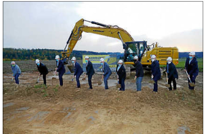
Die Projektpartner des Gesundheitscampus Calw und Vertreter der Kommunalpolitik griffen anlässlich des Beginns der inneren Erschließung des Campus-Areals gemeinsam zum Spaten.

Über den aktuellen Stand der Umsetzung des Medizinkonzepts des Landkreises Calw kann sich die interessierte Öffentlichkeit auf der Projektwebsite zum Medizinkonzept unter www.medizinkonzept-kreis-calw.de informieren.