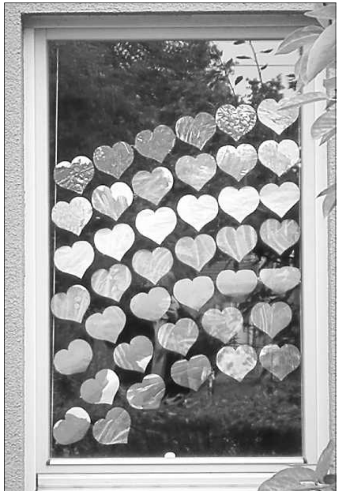
Reichlich beschenkt mit Gottes Liebe

Im Pfarramts-Büro ist dienstags von 9 bis 12 Uhr und freitags von 16 bis 18 Uhr die Sekretärin, Frau Herrmann, unter Tel 8196 zu erreichen.