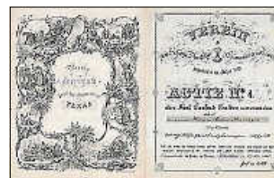
Aktie des Mainzer Adelsvereins