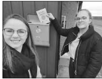
So kommt die Post zu den Mädels :)

Auch diese Woche werden die Mädels der Mädelsjungsch was in ihrem Briefkastenjungsch finden.