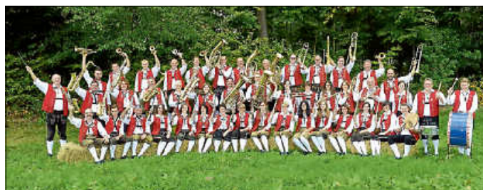
Trachtenkapelle Altburg e.V.