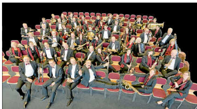
Blasmusikverein Oranienburg e.V.