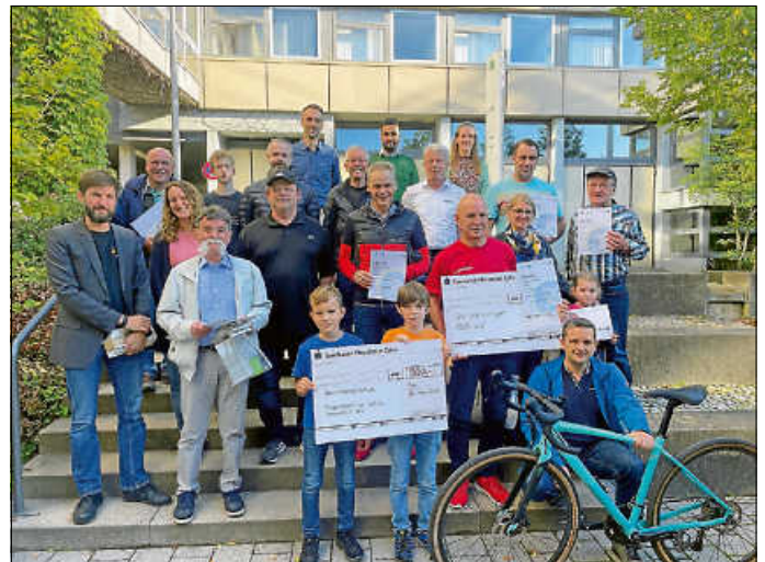
Die Gewinner des diesjährigen Stadtradeln im Kreis Calw