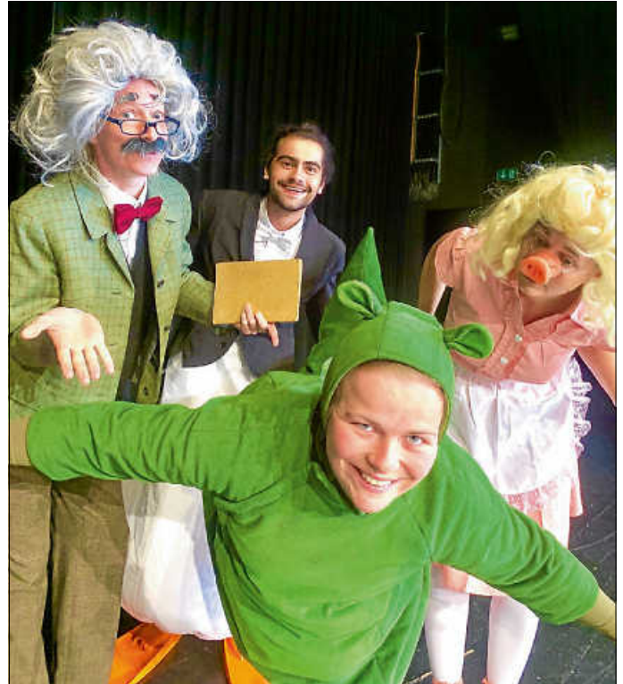
Szene aus dem Familienstück „Urmel aus dem Eis“