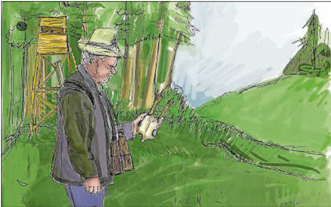
Zeichnung: Ilona Trimbacher

Anmeldung: info@teinachtal.de | 07053 9205040