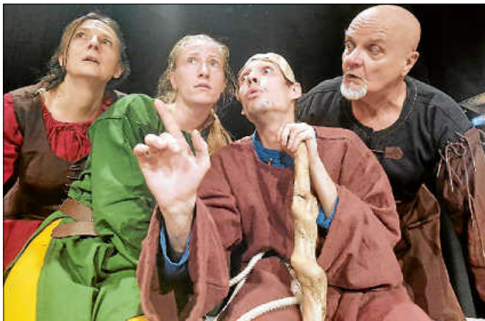
Szene aus dem Stück „Ronja Räubertochter“

Datum: 04.02.2024 | 16:00 Uhr Ort: Ko-Ni Zavelstein Tickets: ab 10,00 € über das Regionentheater aus dem schwarzen Wald | www.regionentheater.de | Tel. 0160 96238983