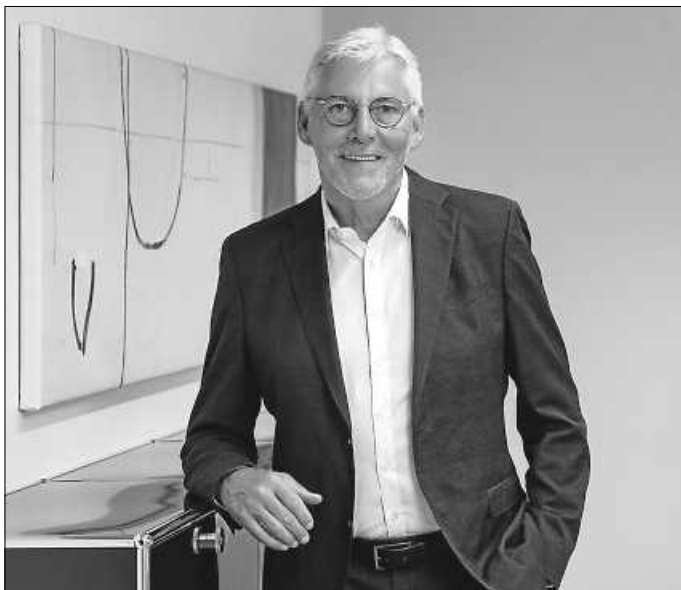
Landrat Helmut Riegger