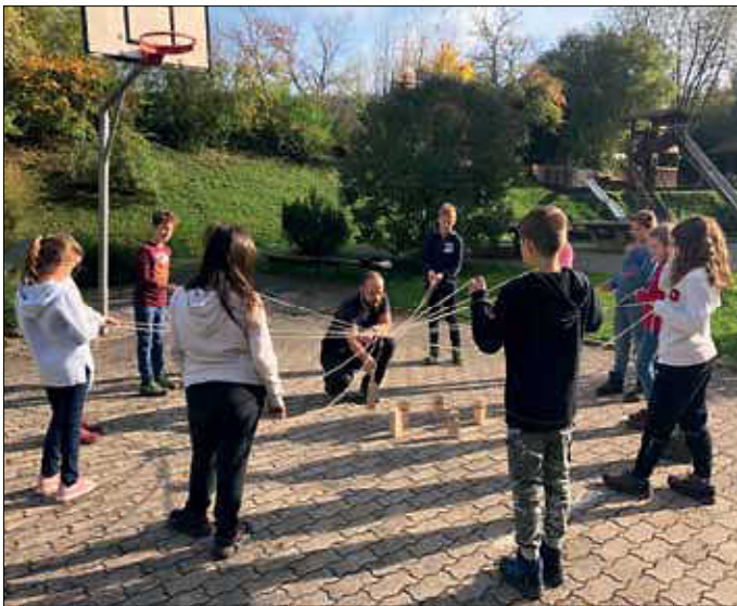
Nur im Team kann die Aufgabe erfolgreich bewältigt werden. Fünftklässler/innen bei den Kennenlertagen an der GMS Neulach.

sehr positiv: Tapfer wurde die Wanderung bewältigt und es gab fast kein „Jammern“ oder fußmüde Schüler. Auf dem idyllischen Wanderweg, der über den Fledermauspfad und vorbei am Besucherbergwerk ging, machte sich schnell der gute Geist, der den folgenden Tagen innewohnte, bemerkbar. Von Beginn an wurde ein „Durchmischen“ der Klassen begünstigt um als eine Stufe zusammenzuwachsen. Angekommen im zuhause auf Zeit für die nächsten beiden Tage, bezogen die Schülerinnen und Schüler ihre Zimmer. Als erster gemeinschaftsfördernder Punkt hieß es dann individuelle Zimmerschilder zu gestalten, welche bei Abreise prämiert wurden. Diesem Credo folgend wurden die Schülerinnen und Schüler nun für den restlichen Tag bunt gemischt in Kleingruppen aufgeteilt um in verschiedensten Sozial- und Kooperationsspielen ein Zusammenwachsen der einzelnen Gruppen zu fördern. Auch hier zeigte sich wiederholt die positive Grundhaltung der Kinder die mit viel Inbrunst und Einsatz die verschiedenen Angebote wahrgenommen haben.