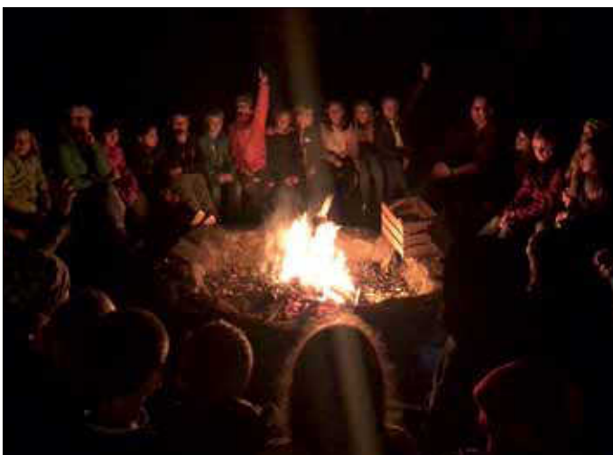
Das Lagerfeuer durfte auch in diesem Jahr natürlich nicht fehlen.

Ebenso begeistert nahmen die „Fünfer“ das reichhaltige Spiel- und Sportangebot des ansässigen Geländes wahr – Fußball, Klettern, Trampolin, Karussell, etc. – die Kinder waren kaum zu bremsen und fielen abends erschöpft aber glücklich ins Bett.